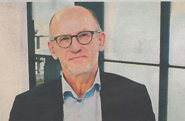
SLIPPER TALL TORSDAG: Bouvet, som ledes av Sverre Hurum, har i likhet med Itera gitt en bedre avkastning enn hovedindeksen og majoriteten av de svenske konkurrentene de siste tre månedene.