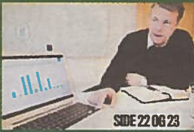
SIDE 22 OG 23

Vil fyre opp stemningen i annonsemarkedet